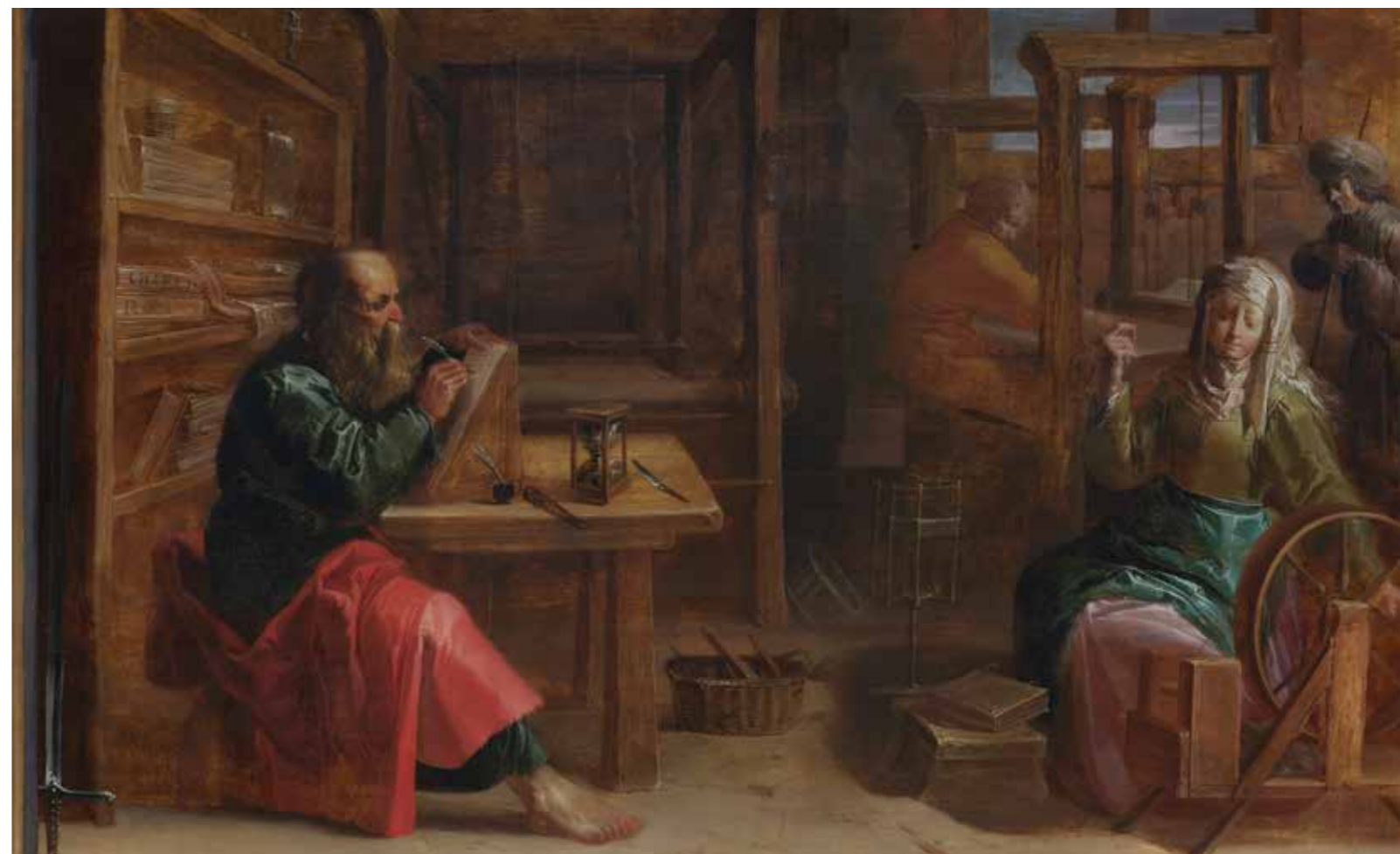
Jan van de Venne, San Paolo nella casa di Aquila e Priscilla , Anversa, Plantin-Moretusmuseum,

In occasione dell'«Anno della Famiglia Amoris Laetitia » inaugurato da Papa Francesco il 19 marzo 2021 che celebra i cinque anni dalla pubblicazione dell'esortazione apostolica Amoris Laetitia e che si concluderà il 26 giugno 2022 in occasione del X Incontro mondiale delle famiglie a Roma con il Santo Padre, ci poniamo sulle orme di Aquila e Priscilla per metterci in ascolto di testimoni della Chiesa delle origini e poter evidenziare prassi di pastorale per il nostro tempo.